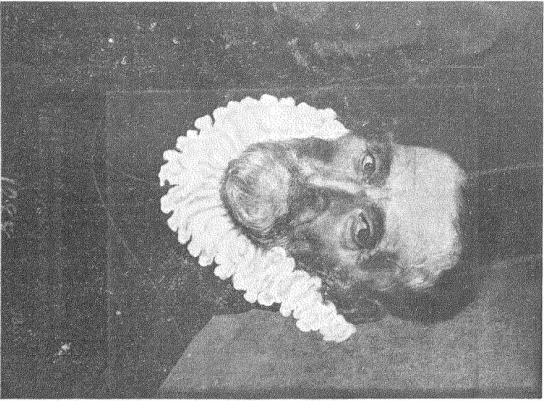
“Retrato de hombre anciano.”