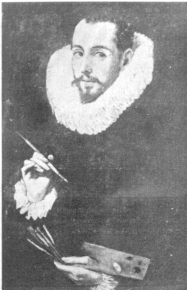
"Retrato de un pintor.. ¿Autorretrato de Tristán?"

Lienzo de 0,81 × 0,56 que se conserva en el Museo de Pinturas de Sevilla