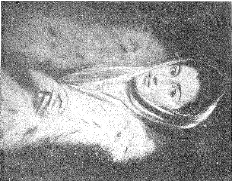
“La Dama del Armijo.” La supuesta hija del Grego.

Cuadro de 0,47 x 0,34 que, como obra de Luis Tristán, alzó a el Museo Nacional del Prado (núm. 1.158 del Catálogo).