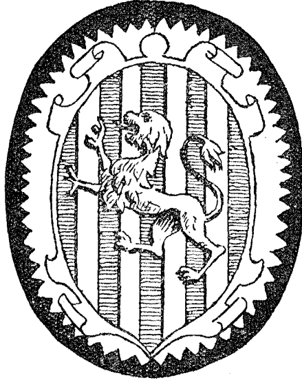
(Sello, de placa, de los Sanchez Coello) (1)

de mi linaje paterno y materno que es a tal como de suso va firmado y ansimismo sellado con el sello usual de que yo usaba y acostumbraba a sellar del blason y armas de mi nobleza Paterna q constan de un escudo con un leon Rapante sobre las vandas o barras de Aragon. . . . en la ciudad de Toledo a veynte y cinco del mes de Julio de el presente año de mil y seyscientos y veinte y seys. . . .